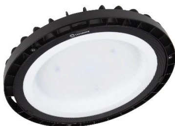
De arriba abajo: estanca Damp Proof Slim ECO, panel Comfort y nueva campana High Bay Compact con 225W en temperatura de color 4000K.